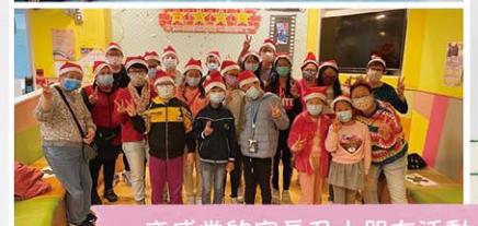
雍盛堂的家長及小朋友活動