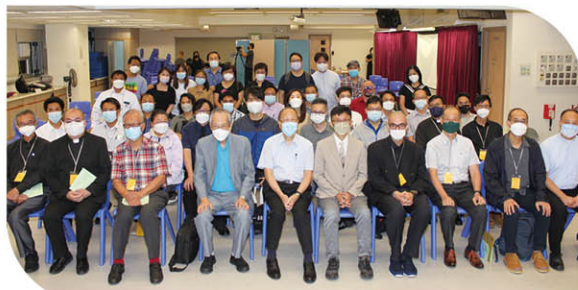
林雅各紀念神學講座：教會崇拜中的經課講道