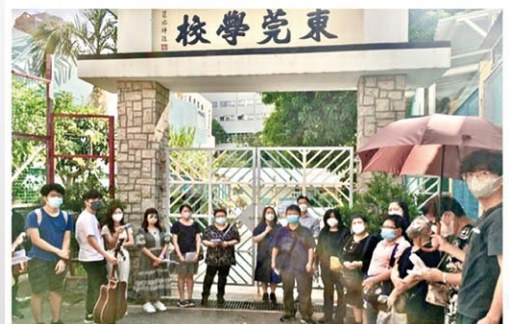
10月2日上水東莞學校有雍盛堂的弟兄姊妹來第一次崇拜，舉行異象分享會及環校祈禱。