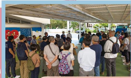
路德會全同工探訪東莞學校

學校以「陶造愉快的學習環境，讓學生健康地成長」、「設計以學生為本位的校本課程」、「學術以外，建立音樂、體育及藝術校園」、「多元化的英文教學，提升英語能力」、「正向教育、培育學生敦品力學」為發展方向。學校緊貼教育發展趨勢，與時並進，使本校成為區內一所富特色、可稱道的小學。現配以本會參與，開展福音工作，定能培養賢能兼備的青少年新一代！