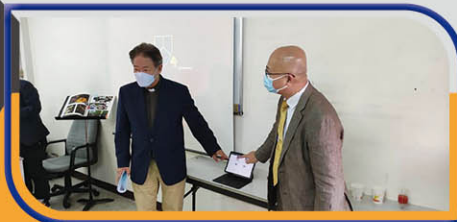
戎子由會長主持開幕儀式