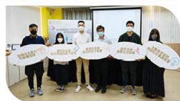
新聞發佈會獲得多個傳媒報道