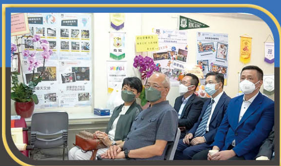
前教育局局長吳克儉太平紳士(右四)，麥潤壽 BBS MH (右二)，立法會議員鄧飛校長(右一)出席典禮