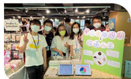
「蟲心度遊」計劃攤位