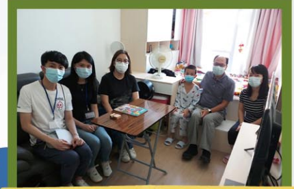
皇后山邨社區佈道活動留影

聖路加堂位於粉嶺皇后山邨。皇后山邨共有7座出租公屋，提供8865個住宅單位，連同毗鄰山麗苑6座居屋，整個皇后山公營房屋項目人口超過3萬，是一遍廣大的福音禾場。本會社會服務處獲政府委託，於該邨開設「皇后山綜合服務中心」，預計於12月尾開始運作，服務邨內的青少年。屆時，聖路加堂會與服務中心會緊密協作，將福音與社會服務結合，服務邨內居民。